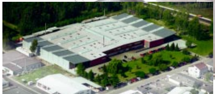
Werk in Speyer / Deutschland Production facilities in Speyer / Germany

Centerless grinding machines for cylindrical and conical parts, brushing and deburring machines, rotary tables, machines between centers, special machines, grinding and polishing machines, hand grinding machines