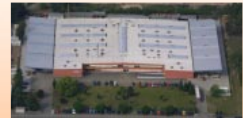
Werk in Speyer Production facilities in Speyer